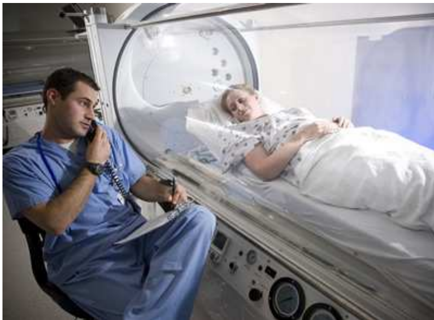
Figura 15.2: Câmara de Oxigênio Hiperbárico

ele não concordar, ele deve ter uma razão lógica. É comum encontrar médicos que simplesmente não estão interessados em terapias naturais sem motivo real. Então, se ele não tem nenhuma razão lógica, você deve encontrar outro oncologista que compreenda terapias naturais. Se ele lhe dá uma razão que parece fazer sentido contra uma determinada terapia, você ainda deve obter segundas opiniões de outros médicos.