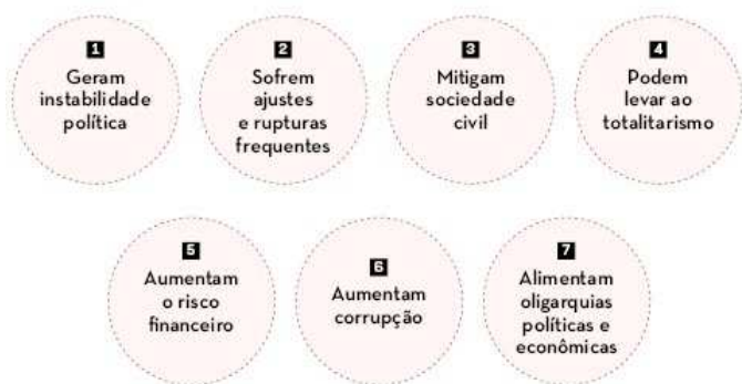
QUADRO 9 CONSTITUIÇÕES INTERVENTORAS

alta intervenção do governo na economia com o New Deal, entre 1933 e 1937. Para vencer a depressão econômica, a gestão do presidente democrata Franklin Delano Roosevelt (* 1882 - † 1945) investiu maciçamente em obras públicas, estabeleceu controle de preços de diversos produtos, reduziu a jornada de trabalho para criar novos postos e chegou ao extremo de determinar a destruição de estoques de commodities como trigo, milho e algodão com o propósito de conter a queda de preços desses gêneros agrícolas.