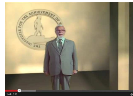
Figura 2: Glenn Doman nos Institutos

(imagens dos) Institutos para o Desenvolvimento do Potencial Humano